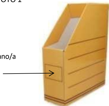
Foto del alumno/a